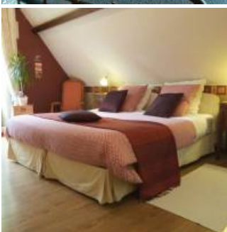
Coup de coeur

Le Domaine de Joreau est un point de départ formidable vers des découvertes culturelles, naturelles et gastronomiques. Le GR3 et la « Loire à Vélo » passent directement devant la propriété ! Des escapades