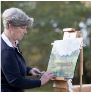
Coup de coeur

Accès privilégié à la propriété d'un très grand intérêt pour les naturalistes et les photographes.