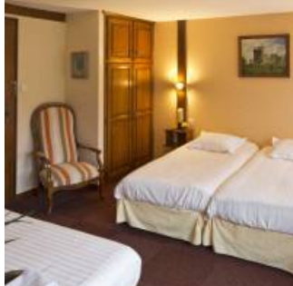
Coup de coeur

Vous recherchez l'authenticité et le calme? Passionnés de rochers et de forêts, amoureux des vieilles pierres, amateurs de promenades et randonnées, à pieds, en VTT ou a cheval, Ici petits et grands trouveront leur bonheur.