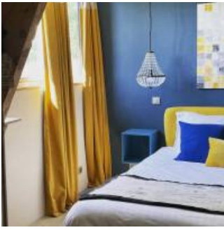
Coup de coeur

Un petit déjeuner à base de produits locaux et une décoration élégante, chaleureuse et zen.