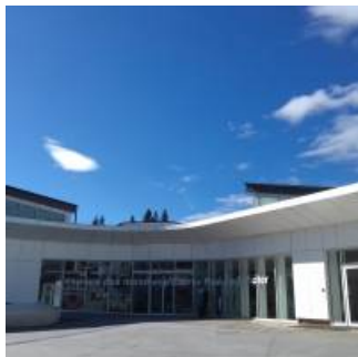
Coup de coeur

Un site porteur de sens au regard de la sensibilisation du public aux enjeux climatiques ;