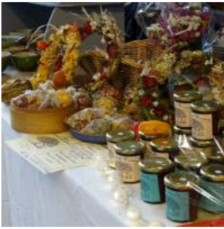
Coup de coeur