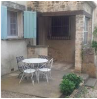
Coup de coeur

En période estivale, quand l'accès au massif forestier est réglementé par un code couleur, un drapeau de la couleur du jour est hissé en bord de piscine pour guider les clients en un coup d'œil.