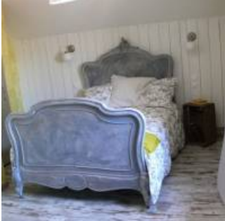
Coup de coeur

Inutile de vous encombrer de vos courses pendant le voyage, Lorelei vous suggère une liste de produits locaux et bio, prend votre commande et vous remplit le frigo de bons produits fermiers et artisanaux de l'Avesnois!