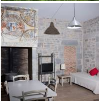
Coup de coeur

Les deux gîtes sont situés au premier étage d'une aile de l'ancien prieuré de la commune.