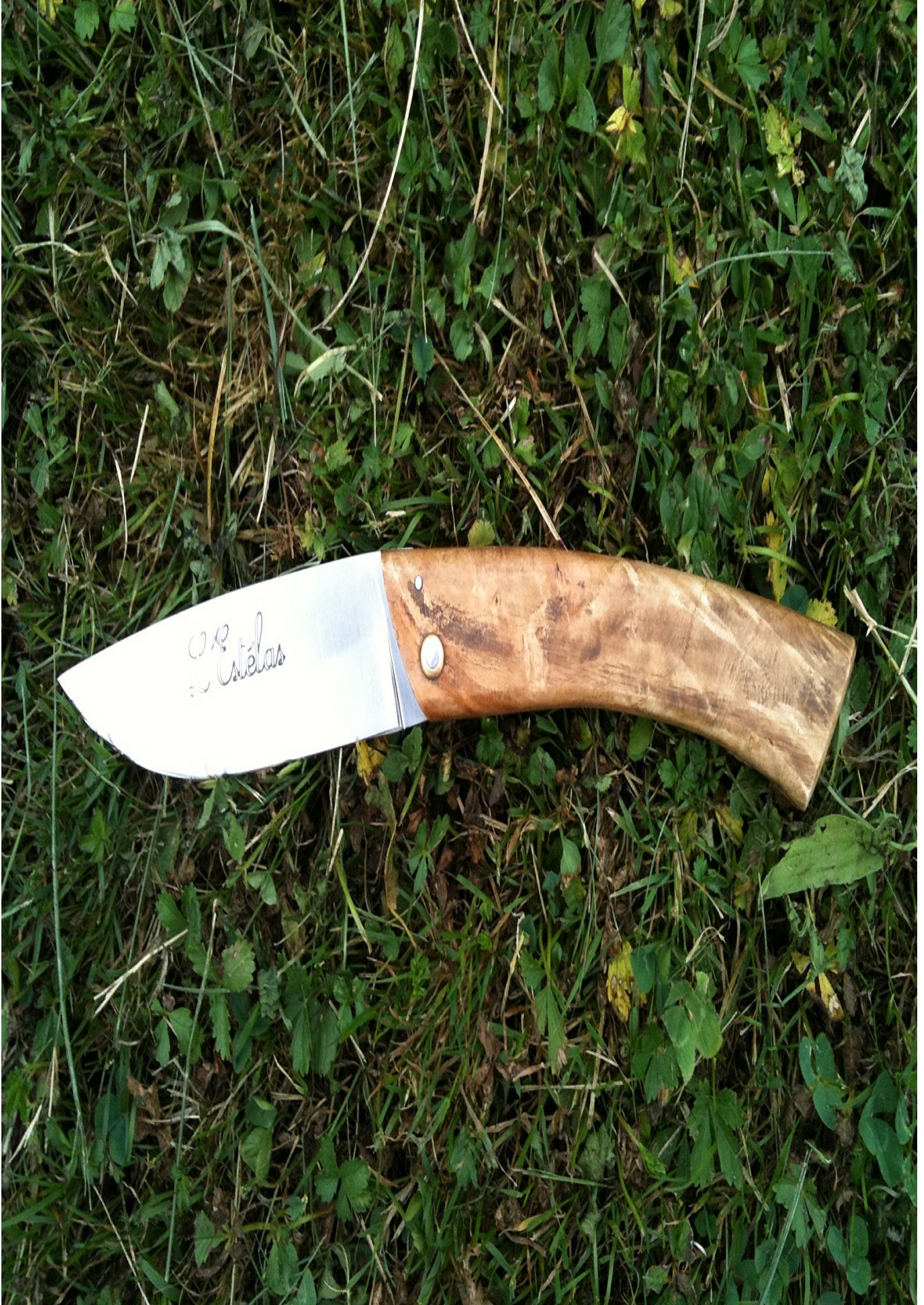
Le couteau de Pays

Estélas ou Couserannais, tous deux sont forgés en acier français et confectionnés à partir d'essences de