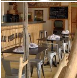
Coup de coeur

Aucun additif n'est ajouté au sel, les aromates sont issues de l'agriculture biologique ou sauvages, Projet de bâtiment de séchage et transformation avec panneaux photovoltaïques et osmose inverse pour la production d'eau douce et récupération de l'eau saumâtre pour la production de sel.