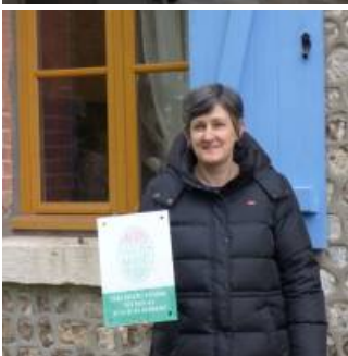
Coup de coeur

Cette charmante bâtisse en pierre, avec les arbres et les oiseaux pour voisinage, est un pied à terre parfait pour profiter de l'immensité de la forêt de Brotonne.