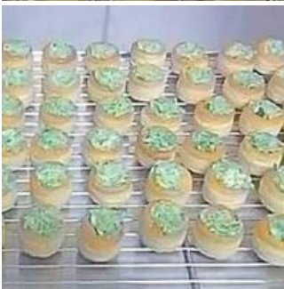
Coup de coeur

En plus des escargots, une ferme avec des produits diversifiés : miels et laine.