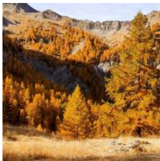
Coup de coeur

L'équipe de Destination Queyras compte plusieurs accompagnateurs de moyenne montagne qui connaissent parfaitement le terrain et sont de véritables experts pour conseiller des séjours sur mesure. La construction de nouveaux séjours se fait toujours en équipe, tout autant que les réflexions plus stratégiques sur le développement et l'avenir de l'agence.