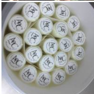
Coup de coeur

Boucabelle des Baux est un élevage herbassier, l'alimentation des chèvres se fait essentiellement sur parcours.