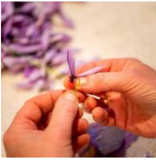
Coup de coeur

Valérie vous accueille dans sa magnifique boutique aménagée, où vous pouvez retrouver sa large gamme des produits à base de safran.