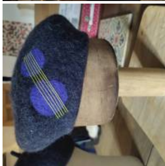
Coup de coeur

Son dynamisme, son envie de participer aux dynamiques locales, et le perfectionnisme du travail de ses pièces.