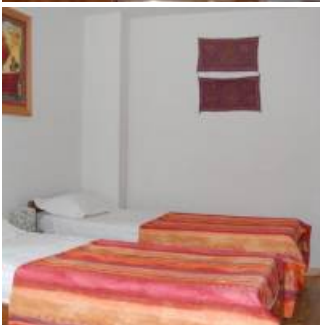
Coup de coeur

Découvrez les spécialités catalanes fait à partir de produits frais et locaux en priorité à la table d'hôtes. Parmi elles, les joues de porc, les « Boles de picolat », la morue à la catalane, l'agneau de Cerdagne et