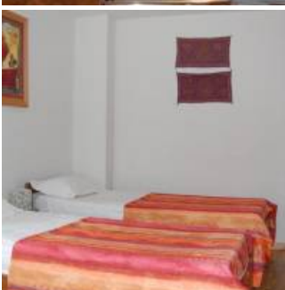
Coup de coeur

Découvrez les spécialités catalanes fait à partir de produits frais et locaux en priorité à la table d'hôtes. Parmi elles, les joues de porc, les « Boles de picolat », la morue à la catalane, l'agneau de Cerdagne et