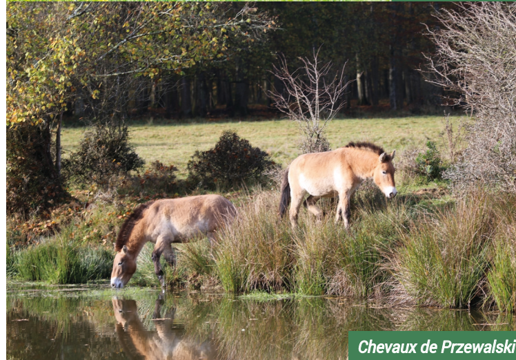
Chevaux de Przewalski