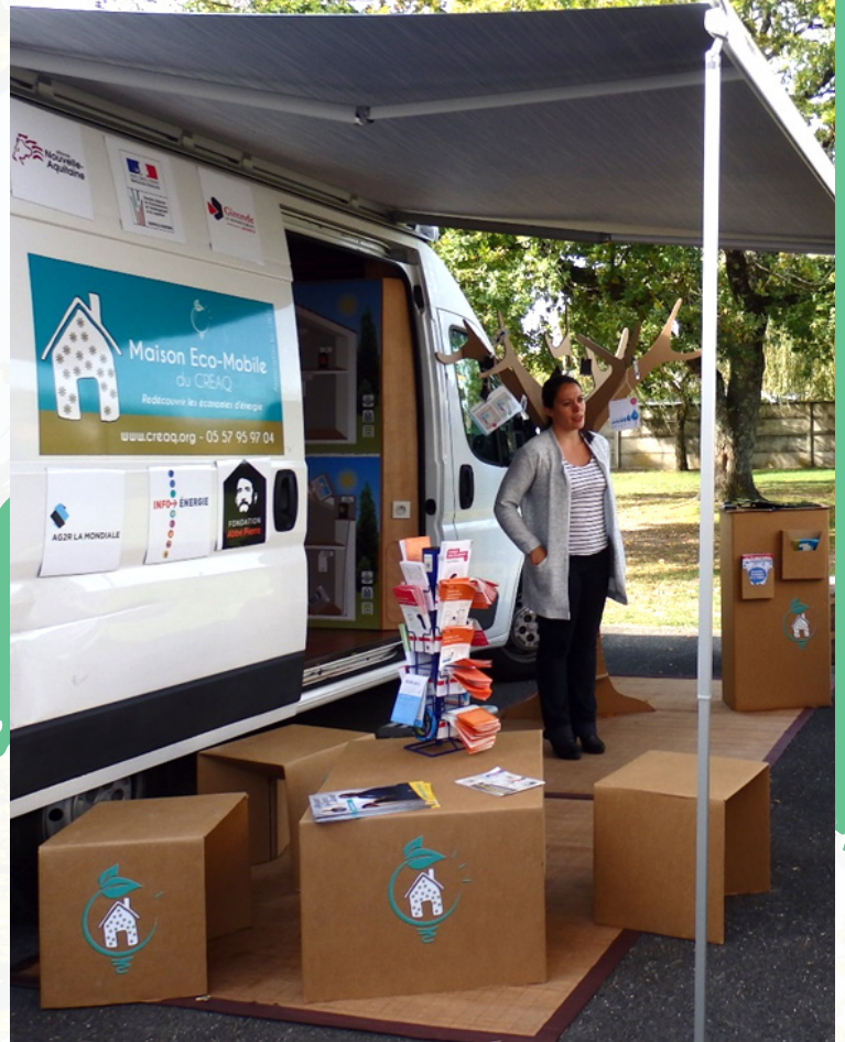
Maison Eco-Mobile CREAQ

Les plus-values : Lier santé, qualité environnementale et insertion sociale ; Combiner les actions pour amplifier les effets